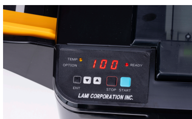
Alimentar documentos no tabuleiro, pressionar o botão Start, e afastar-se. Irá laminar de forma totalmente automática