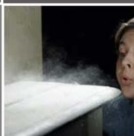
PÓ E PARTÍCULAS FLUTUANTES