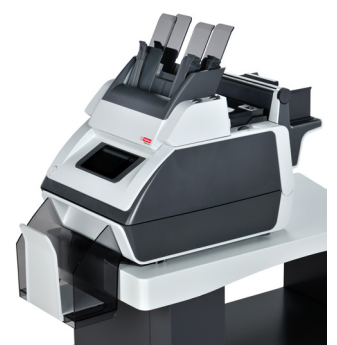
TSI-2.5 S 2,5 STATIONS