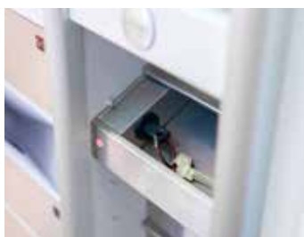
Beheer van Sleutels- en bezoekers