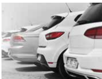
Beheer van voertuigenpark