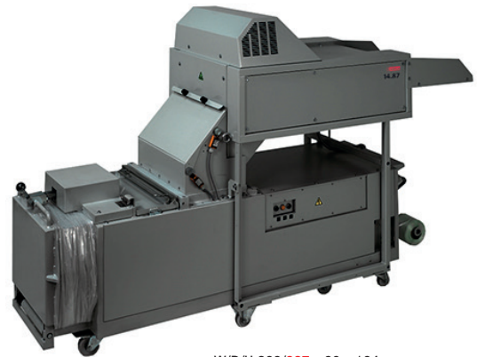
W/D/H 268/327 x 80 x 164 cm

Decennialang hebben de intimus® heavy duty vernietigers bewezen centraal geplaatste stukken apparatuur te zijn voor de privacyvriendelijke afvoer van media die niet langer gebruikt wordt. Het modelportfolio bestaat uit vele variaties die tot 550 vellen/uur tot zelfs volledige folders in één enkele handeling kunnen vernietigen. De ruime invoertafel met geïntegreerde invoerband zorgt voor gecontroleerd, moeiteloos, veilig en snel laden. Het versnipperde materiaal wordt in een grootschalige of mobiele opvangbak of een bak op een draaibaar mechanisme onder het snijmechanisme opgevangen. De versnipper-pers-combinaties zijn aan een balenpers gekoppeld zodat het versnipperde materiaal direct en volledig automatisch tot compacte balen wordt geperst. Het verminderde ruimte effect in vergelijking met het los verzamelen van het versnipperde materiaal is zo'n 70%.