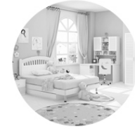
CHAMBRES À COUCHER