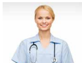
Logistique des vêtements de travail

Une des solutions présentées vous intéresse ou vous avez des questions ? Alors n'hésitez pas à nous contacter. Notre équipe se fera un plaisir de recevoir votre e-mail ou votre appel téléphonique.