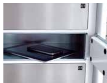
Gestion des équipements de travail

Une des solutions présentées vous intéresse ou vous avez des questions ? Alors n'hésitez pas à nous contacter. Notre équipe se fera un plaisir de recevoir votre e-mail ou votre appel téléphonique.