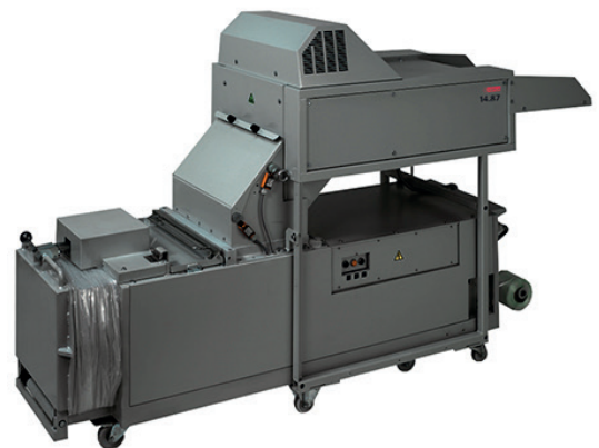
W/D/H 268/327 x 80 x 164 cm

Depuis des décennies, les destructeurs industriels intimus® sont des acteurs majeurs de la destruction des medias supports de données sur la vie privée. La gamme offre des modèles permettant de gérer jusqu'à 550 feuilles/h, comme des dossiers complets, en une seule opération. La grande table d'alimentation avec tapis roulant d'alimentation intègre un chargement contrôlé, sans effort, sûr et rapide. Le matériau ainsi détruit est recueilli dans des conteneurs mobiles ou pivotants de grande capacité au-dessous du mécanisme de découpe. Les combinaisons déchiqueteuse-presse sont couplées à une presse à balles pour un compactage entièrement automatique immédiat. L'effet de réduction par rapport à la réception sans compactage des découpes est d'environ 70 %.