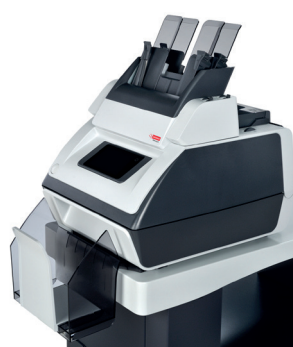
TSI-2.0 S 2 STATIONS