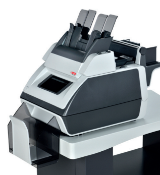
TSI-2.5 S 2,5 STATIONS