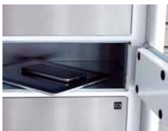
Gestion des équipements de travail