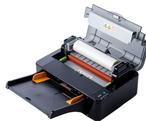
Cambio rápido de película con cubierta de gran apertura y el método película-casete