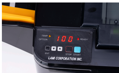
Cargue papel en la bandeja, pulse el botón de inicio y desprecúpese. Plastificará de forma totalmente automática