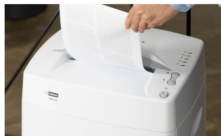
Tritura documentos con clips y grapas.