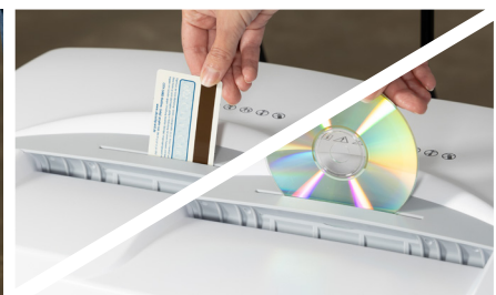
Las tarjetas de crédito y los CD se pueden triturar a través de una ranura de alimentación separada.