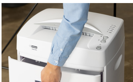
Papelera extraíble de 42 litros con ventana de visualización.