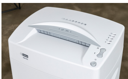
Uso intuitivo gracias a los botones claros y la pantalla LED.