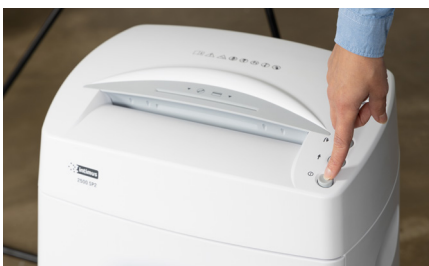
Función de inicio/parada automática y tecnología anti-atasco de papel.