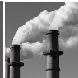
Contaminación de las industrias