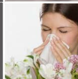
Polen y alérgenos