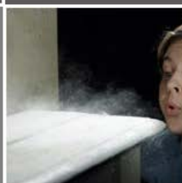
Polvo y partículas flotantes