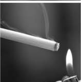
Humo de cigarrillos