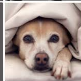
Pelo de su mascotas