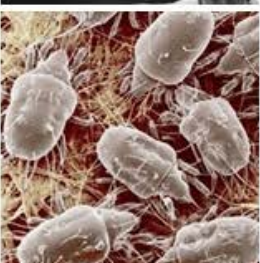
Ácaros y similares