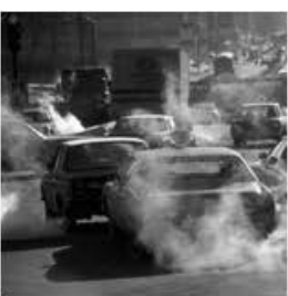
Emissiones de automóviles