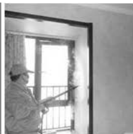
Contaminación del hogar