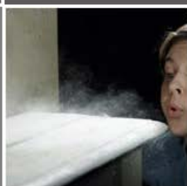
Polvo y partículas flotantes