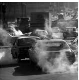
Emissiones de automóviles