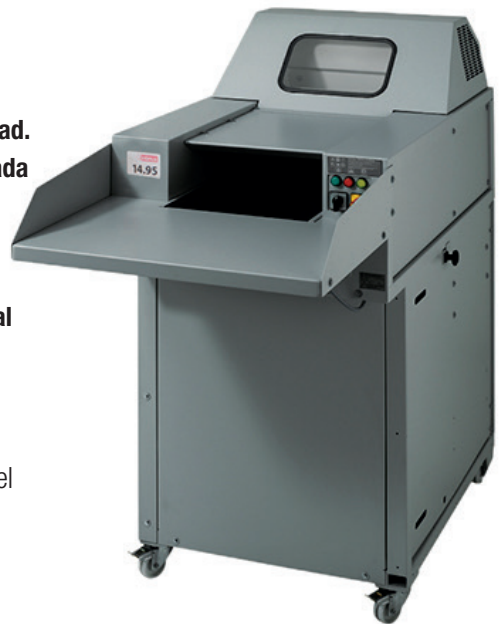
A/P/H 80/120 x 168 x 164 cm

Durante décadas, las destructoras de alto rendimiento intimus® han demostrado ser piezas esenciales del equipo empleado para desechar los medios que ya no se utilizan con la máxima privacidad. La espaciosa bandeja de entrada con cinta transportadora integrada permite cargar el material sin esfuerzo y de manera rápida y segura. El material destruido se recoge en contenedores móviles de gran formato situados debajo del mecanismo de corte. Los combos destructora-prensa se acoplan para compactar el material destruido en fardos de manera rápida y totalmente automática. El efecto reductor comparado con los sistemas individuales es de aproximadamente un 70%.