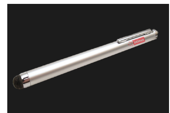
Lápiz óptico para un manejo cómodo de la pantalla táctil