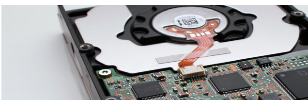
Borrado seguro y completo de datos en discos duros