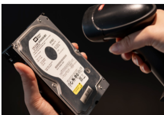
Escanea los números de serie de los discos duros antes de borrarlos