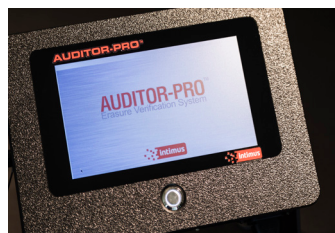
Crea certificados de borrado Operación con pantalla táctil