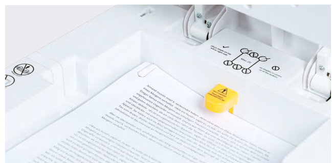
Vernichtet auch Dokumente mit Büro- und Heftklammern.