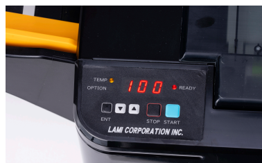
Legen Sie Papier in das Fach ein, drücken Sie die Starttaste, das war's. Das Gerät laminiert vollautomatisch