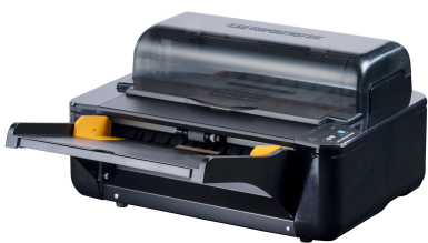
Kompakte Größe, die überall Platz findet

Beim Revo Any geht es nicht nur um Geschwindigkeit - es geht auch um Bedienbarkeit. Die einfache Folieneinstellung sorgt dafür, dass jeder das Gerät benutzen kann, auch wenn er noch nie laminiert hat. Und dank der fortschrittlichen Technologie und der qualitativ hochwertigen Konstruktion können Sie sich darauf verlassen, dass Ihre Artikel jedes Mal sauber und gestochen scharf aussehen. Ganz gleich, ob Sie Dokumente, Fotos oder andere Materialien laminieren müssen, mit dem Revo Any sind Sie bestens gerüstet.