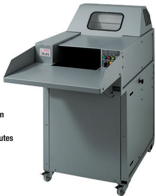
L/B/H 80/120 x 168 x 164 cm

Die intimus® Großshredder haben sich seit Jahrzehnten als zentral positionierte Anlagen für die datenschutz-gerechte Entsorgung ausgedienter Datenträger bewährt. Der geräumige Aufgabebereich mit integriertem Einzugsförderband sorgt für kontrolliertes, ermüdungsfreies, sicheres und zügiges Beschicken. Das geshredderte Material wird im großvolumigen, fahrbaren bzw. ausschwenkbaren Auffangbehälter unter dem Schneidwerk gesammelt. Die Shred-Press Kombinationen sind gekoppelt mit einer Ballenpresse zur sofortigen vollautomatischen Verdichtung des Schnittgutes zu kompakten Ballen. Der Reduzierungseffekt gegenüber der losen Sammlung des Schnittgutes beträgt ca. 70%.